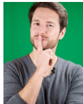
Mirko Drotschmann alias Mr. Wissen2Go

Bundesminister für Wirtschaft und Energie